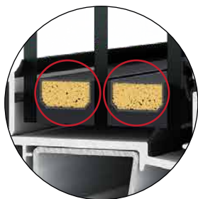
Trojasklo s „teplou hranou“

Izolační trojasklo plněné vzácným plynem s ochranou proti tvorbě kondenzátu díky použití Swisspacer „U“.