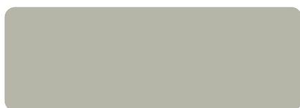
RAL 7032 Kieselgrau