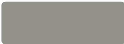
RAL 7030 Steingrau