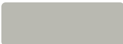
RAL 7044 Seidengrau