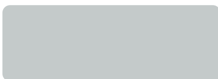
RAL 7035 Lichtgrau