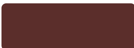
RAL 8015 Kastanienbraun