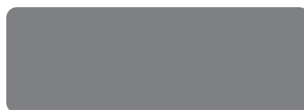
RAL 7037 Staubgrau